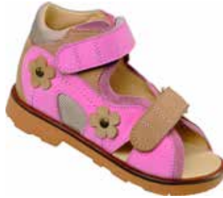
Abb. 7: Antivarussandale