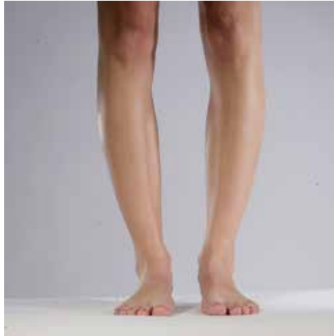
Abb. 25: O-Beine .....