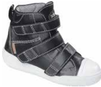
Abb. 33: Orthesenschuh