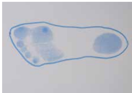
Abb. 14: Trittspur Hohlfuß

Je nachdem, ob der Fuß infolge seiner Fehlstellung die Körperlast stärker mit dem Ballen oder mit der Ferse aufnimmt, unterscheidet man beim Hohlfuß zwei Formen: den Ballenhohlfuß und den Hackenhohlfuß. Letzterer ist die seltenere Form des Pes excavatus; hierbei kommt es zu einer Steilstellung des Fersenbeins.