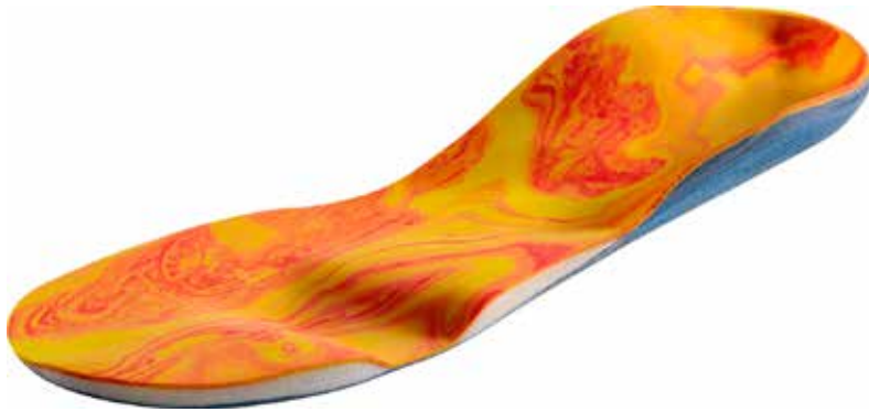
Abb. 21: propriozeptive/ sensorische Einlage