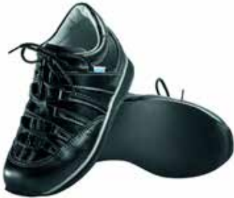
Abb. 6: Antivarusschuh