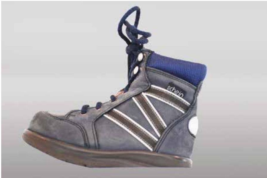
Abb. 28: Schuhzurichtung mit Negativabsatz zur Dehnung der verkürzten Wadenmuskulatur

Der Hauptwirkungsbereich der Pyramideneinlagen liegt am Vorfuß, der beim Zehenspitzenengang extrem belastet wird. Einerseits wirken die Einlagen passiv, da der Fuß durch eine individuelle Stützhöhe der Stützelemente in eine Normalstellung gebracht wird. Gleichzeitig wirken sie auch aktiv, da sie den Aufbau des Fußes ändern, indem Muskeln und Bänder durch passive Stützwirkung ebenfalls in Normalstellung gezwungen werden. Durch ein Stützelement am Fersenbein wirken die Einlagen auf die Stellung des Rückfußes und üben dadurch Einfluss auf die plantare Torsion aus. In ihrer Handhabung sind die Pyramideneinlagen einfach. Sie verfügen über Stützelemente, die sich durch lösbares Fixieren in einem Schuh befestigen lassen und dadurch exakt auf die zuvor vom Therapeuten festgelegten Unterstützungspunkte einwirken können.