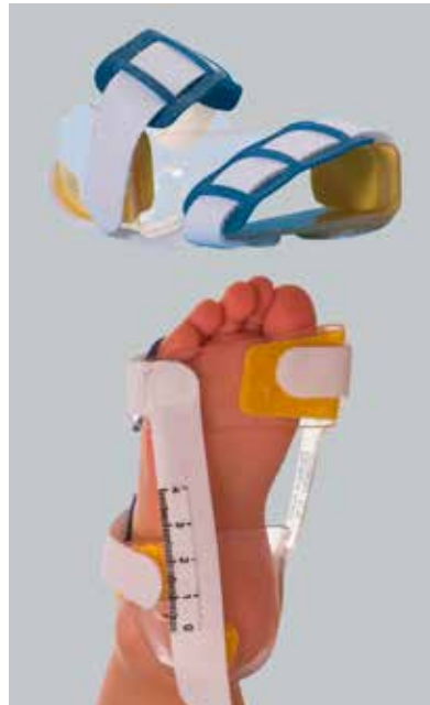
Abb. 11: Sichelfußorthese

Ebenso wie bei der korrigierenden Nachbehandlung des Klumpfußes (siehe Kapitel 1) empfiehlt sich aufgrund der hohen Rezidivneigung des Sichelfußes eine Versorgung mit Antivarusschuhen oder korrigierenden Einlagen, die nach dem Drei-Punkt-Prinzip wirken. Wichtig ist dabei, dass das Schuhwerk einlagengerecht ist (Stabilschuh) und dass Einlage und Schuh eine Einheit bilden. Arzt und Orthopädie-Handwerker müssen den korrekten Sitz der Einlage überprüfen.