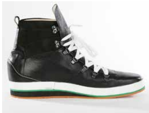
Abb. 34: Maßschuh

Der deutlich knöchelübergreifende hochschäftige Maßschuh ist eine Alternative zu einer Unterschenkelorthosenversorgung. Mit Hilfe der in der Schuhtechnik eingesetzten Materialien kann eine druckumverteilende Bettung erfolgen. Sie ermöglichen Punktentlastungen. Je nach Schafthöhe kann individuell auf die Tonusverhältnisse der Spastivität eingewirkt werden.