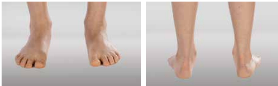
Abb. 15 und Abb. 16: Kindlicher Knick-Senkfuß