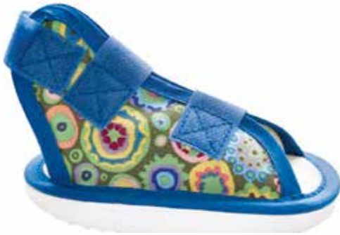
Abb. 10: Kindergipsschuh zur postoperativen Versorgung des kindlichen Fußes