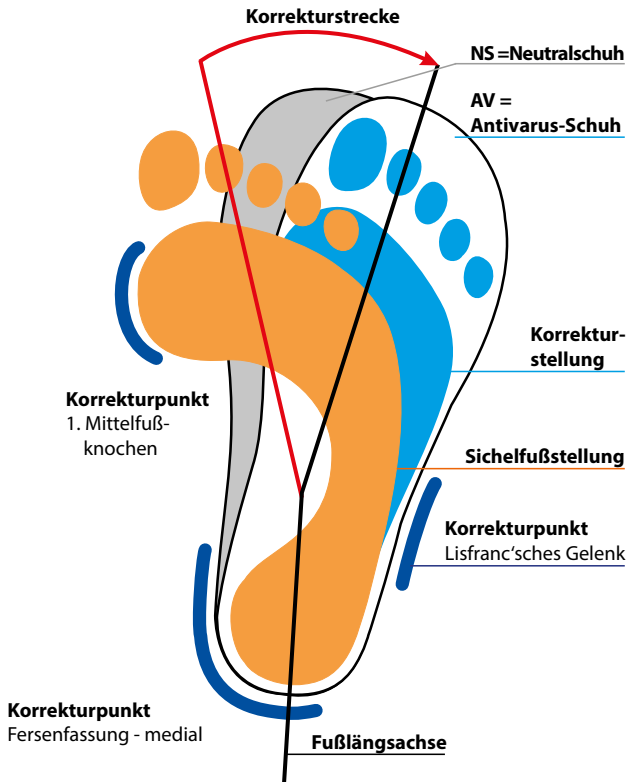
Abb. 5: Korrekturprinzip des Antivarusschuhs