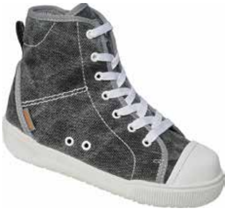
Abb. 29: Stabilschuh zur Führung und Unterstützung des Sprunggelenks

eine feste Fersenkappe verfügen und knöchelumschließend oder knöchelübergreifend sein, insbesondere bei jüngeren Kindern. Bei älteren Kindern ist ein Halbschuh möglich, der aber mindestens über eine Fersenkappe verfügen und fest am Fuß fixiert werden muss, damit Fuß, Schuh und Einlage eine funktionelle Einlage bilden. Des Weiteren sollte der Schuh über einen weichen Vorfuß mit flexibler Sohle verfügen.