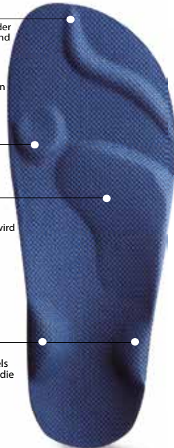
Abb. 20: Erläuterung Pelotten

Steuern die Ausrichtung des Rückfußes und des Sprunggelenks über die Schienbein- und seitliche Wadenmuskulatur. Durch Stimulierung des sogenannten muskulären Steigbügels wird die Muskelreaktionszeit und das Verletzungsrisiko im Sprunggelenk reduziert. Über die Fußreflexzonen wird die Beckenmuskulatur angesprochen.