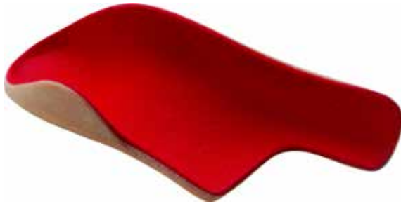
Abb. 12: Einlage mit Drei-Punkt-Korrektur