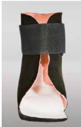
Abb. 30: Innenschuh

Der Innenschuh kommt dann zum Einsatz, wenn initiale Strukturveränderungen am Fuß vorliegen oder aber die Tonusverhältnisse so verändert sind, dass nur mit größerer Kraft die Korrekturstellung des Fußes sichergestellt werden kann. Ein Inneschuh wird nach Gipsabdruck und Leisten gefertigt. Er ist in Verbindung mit Konfektionsschuhen und in der Sommerzeit mit Konfektionssandalen zu nutzen. Ganz allgemein muss jedoch beim Einsatz von Konfektionsschuhen darauf geachtet werden, dass dabei die Sohle breitbasig gestaltet, im Vorfuß flexibel und der Sohlenrand scharfandig begrenzt ist, um so für eine größere Basis zu sorgen, auf der die Kinder ihren Körperschwerpunkt ausbalancieren können. Mehr Sicherheit führt zu weniger Spastik (Tonus), weniger Tonus zu mehr Mobilität und Kontrolle.