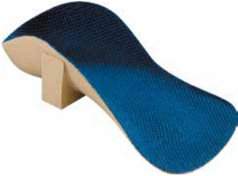
Abb. 19: Langsohlige korrigierende Schaleinlage

bzw. neurologische Einlage bekann-ten Konzept steckt die Überzeugung, dass mit Hilfe gezielter Stimulation eine gestörte Bewegungskoordina-tion verbessert werden kann. Die Propriozeption (Eigenwahrnehmung) umfasst die auf körpereigene Reize ansprechenden Sinnesorgane zur Wahrnehmung der Stellung, Bewe-gung und Orientierung des Körpers und seiner Glieder und Gelenke zu-einander. So sollen sensomotorische Einlagen beispielsweise helfen, eine schwache Muskulatur zu stimulieren oder eine hyperaktive Muskulatur zu kontrollieren. Dadurch können Dys-balancen der Muskulatur – und damit auch Beschwerden in Haltung, Stel-lung, Gleichgewicht und Koordination – gezielt behandelt werden.