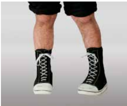
Abb. 3: Kongenitaler Klumpfuß mit Schuhversorgung