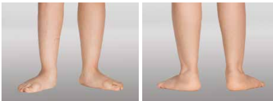
Abb. 17 und Abb. 18: Starker kindlicher Knick-Senkfuß