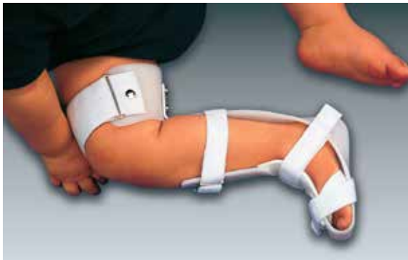
Abb. 4: Korrigierende Klumpfußnachtschiene