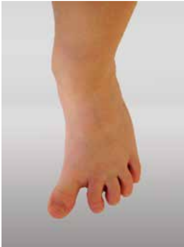
Abb. 8: Sichelfuß

Der Sichelfuß ist die häufigste Fußfehlstellung beim Baby. Der Begriff Sichelfuß (auch Pes adductus genannt) bezeichnet per Definition eine angeborene oder erworbene Fehlstellung des Fußes, bei der sich sowohl der Mittelfuß als auch die Zehen in der sogenannten Adduktionsstellung befinden und verstärkt nach innen gewölbt sind. Zusätzlich weicht beim angeborenen Sichelfuß die Großzehe nach innen ab (= Hallux varus, im Gegensatz zum Hallux valgus). Anders als beim Klumpfuß ist die Fersenstellung beim Sichelfuß normal oder etwas eingeknickt. Meist tritt der Pes adductus beidseitig auf. Jungen haben allgemein häufiger Sichelfüße als Mädchen.