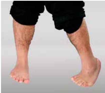
Abb. 1: Kongenitaler Klumpfuß

Der Klumpfuß ist eine komplexe Fehlbildung des Fußes mit einem typischen Erscheinungsbild: Betroffene haben einen Spitz-, Sichel- und Hohlfuß sowie O-Beine. Der Klumpfuß ist angeboren (kongenital) und lässt sich nur durch eine sogenannte Redressionsbehandlung oder eine Operation ausgleichen. Nach den neuesten Erkenntnissen ist der Klumpfuß heute primär konservativ zu behandeln. Er kann bei einem oder beiden Füßen vorkommen und unterschiedlich stark ausgeprägt sein. Meist handelt es sich um eine Kombination von mehreren Fußfehlbildungen und gleichzeitig nach innen gedrehten Fersen (Fersenvarus, O-Stellung des Rückfußes). Zusätzlich ist die Wadenmuskulatur in vielen Fällen unterentwickelt.