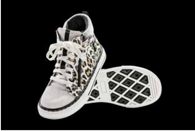
Abb. 23: Stabschuh zur Stabilisierung des Sprunggelenks