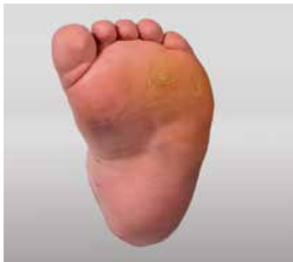
Abb. 2: Kongenitaler Klumpfuß Sohlenansicht