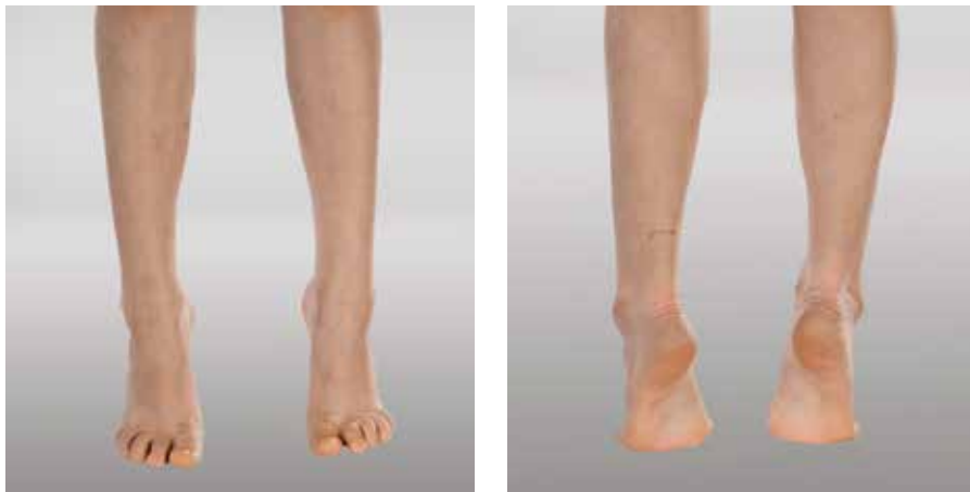
Abb. 26 und 27: Habituelle Zehenspitzen-gang

Je nach Ausprägung können Folgeerkrankungen wie Fußdeformitäten, irreversible Verkürzungen des M. triceps surae (Musculus gastrocnemius) und M. soleus (dreiköpfiger Wadenmuskel) oder Wirbelsäulenschäden auftreten.