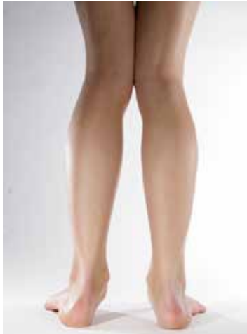
Abb. 24: X-Beine