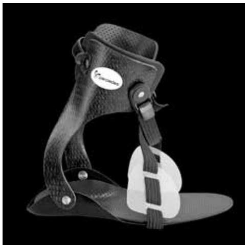
Abb. 31: Orthese

Hier unterscheidet man passive Orthesen (z. B. Nachtlagerungsorthesen) zur Wachstumslenkung und aktive, dynamische Orthesen, die in der Regel während des Tages genutzt werden. Sie können über Gelenke oder Carbonfedern verfügen, um die Gelenkbeweglichkeit zu ermöglichen. Auch sogenannte Quengelorthesen können eingesetzt werden, die über einen dynamischen Zug oder über eine dynamische Krafteinheit im Orthesengelenk für eine kontinuierliche Dehnung der zur Verkürzung neigenden Muskulatur sorgen (Kontrakturbehandlung und -prophylaxe).