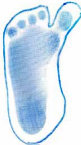
Abb. 9: Trittspur Sichelfuß