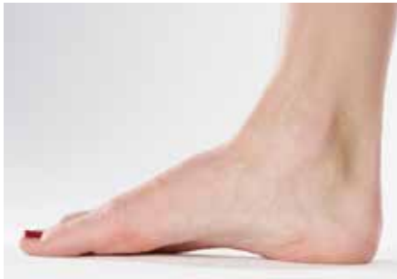
Abb. 13: Hohlfuß

Hohlfüße sind allgemein kürzer und gedrungener als gesunde Füße. Häufig liegt gleichzeitig mit dem Hohlfuß eine Krallen- beziehungsweise Klauenstellung der Zehen vor. Der für einen Pes excavatus typische Fußabdruck zeigt, dass nicht der Mittelfuß die Körperlast trägt, sondern ausschließlich die Ferse und der Vorfuß, häufig auch der laterale Fußrand. Der Hohlfuß bildet gewissermaßen das Gegenstück zum Plattfuß.